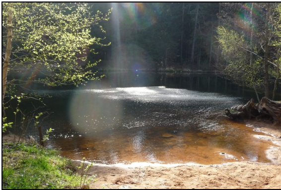
Licht- und Wellenspiele am Stausee