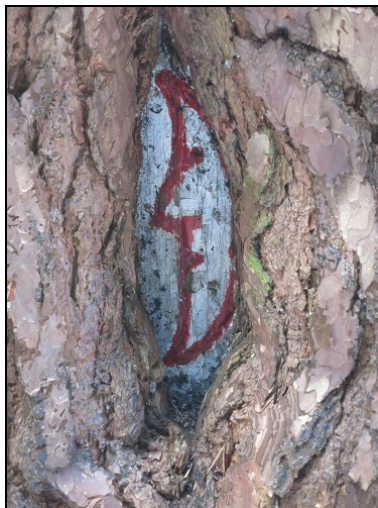
Wegezeichen Halbmond um 1890