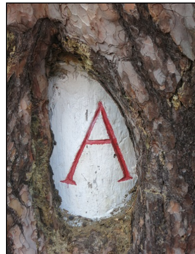
Wegezeichen A-Flügel um 1890