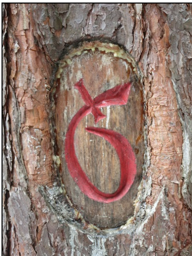
Wegezeichen Kreuz Sechs von 2009 © T. Schubert, 2015